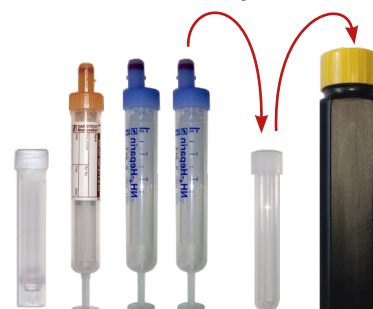
T908 Urin mit Stabilisator

1 x Hep zentrifugieren, Hep-Plasma abpipettieren und sofort lichtgeschützt verpacken!